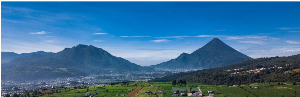
Volcán Santa María – Quetzaltenango

Instituto de Hermanas Bethlemitas - Casa General - Agosto 2023 - Boletín N°. 5