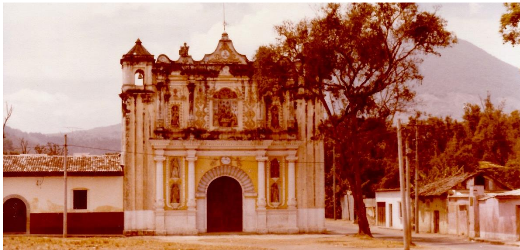
Calle del Hermano Pedro, Antigua Guatemala, abril 1981 - Iglesia del Belén

Instituto de Hermanas Bethlemitas - Casa General - Octubre 2024. Boletín N°. 8